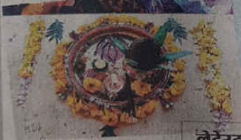
डागा गर्ल्स कॉलेज में जुड़ा सजाओ एवं शालाद रंगोली स्पर्धा