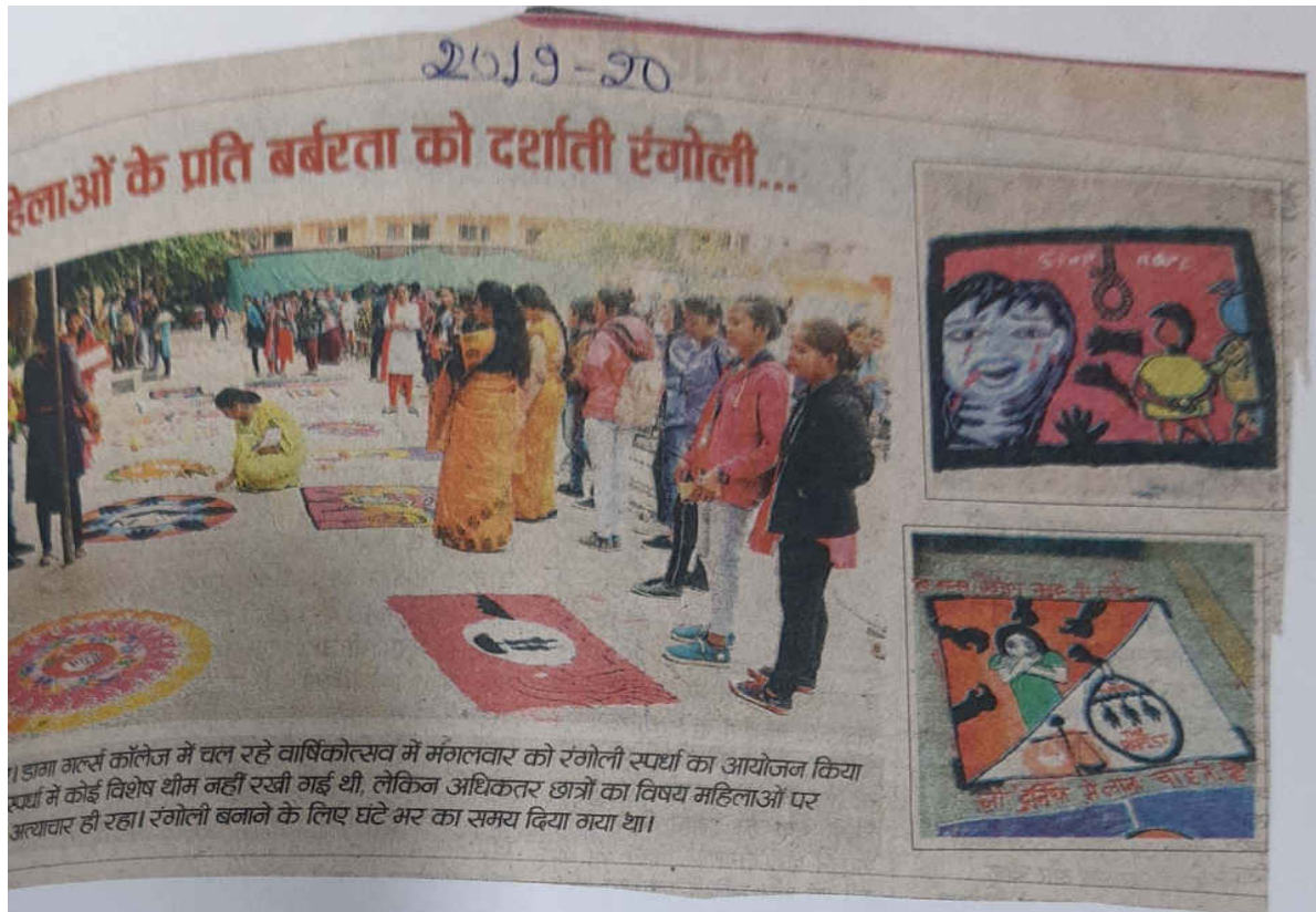
1 डागा मर्ल्स कॉलेज में चल रहे वार्षिकोत्सव में मंगलवार को रंगोली स्पर्धा का आयोजन किया गया। स्पर्धा में कोई विशेष थीम नहीं रखी गई थी, लेकिन अधिकतर छात्रों का विषय महिलाओं पर अत्याचार ही रहा। रंगोली बनाने के लिए घंटे भर का समय दिया गया था।